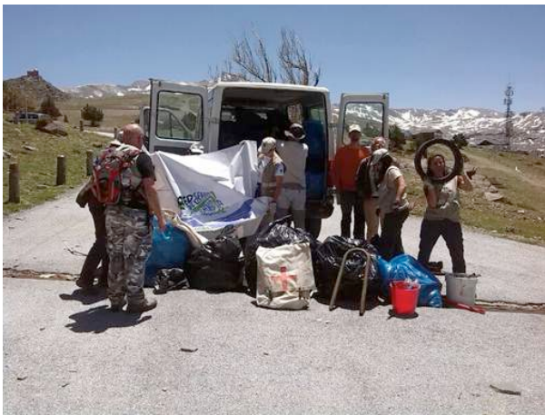
La Red de Voluntariado del Parque Nacional y Parque Natural de Sierra Nevada ha realizado junto al personal del Albergue Universitario, una actividad de limpieza del entorno de la Hoya de la Mora, la entrada al Parque Nacional junto a la estación de esquí.